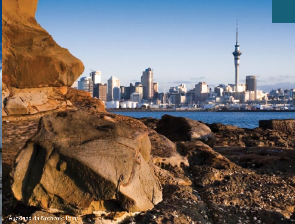
Auckland da Nothcote Point