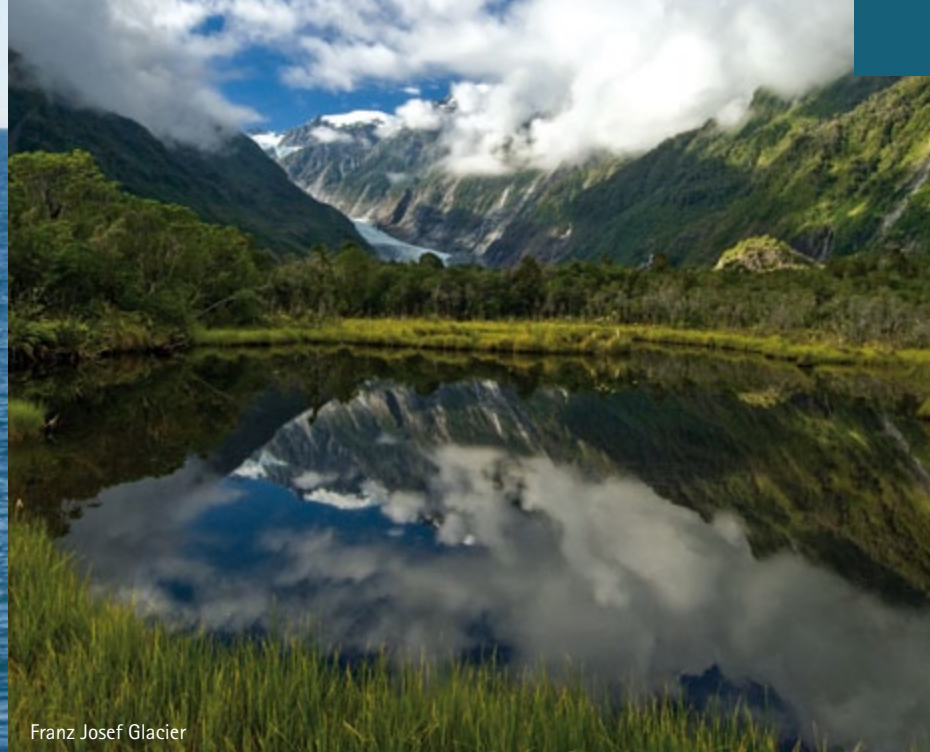
Franz Josef Glacier