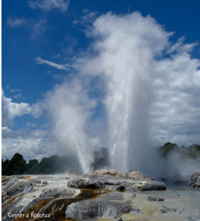
Geysir a Rotorua