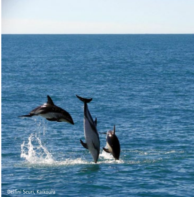
Delfini Scuri, Kaikoura