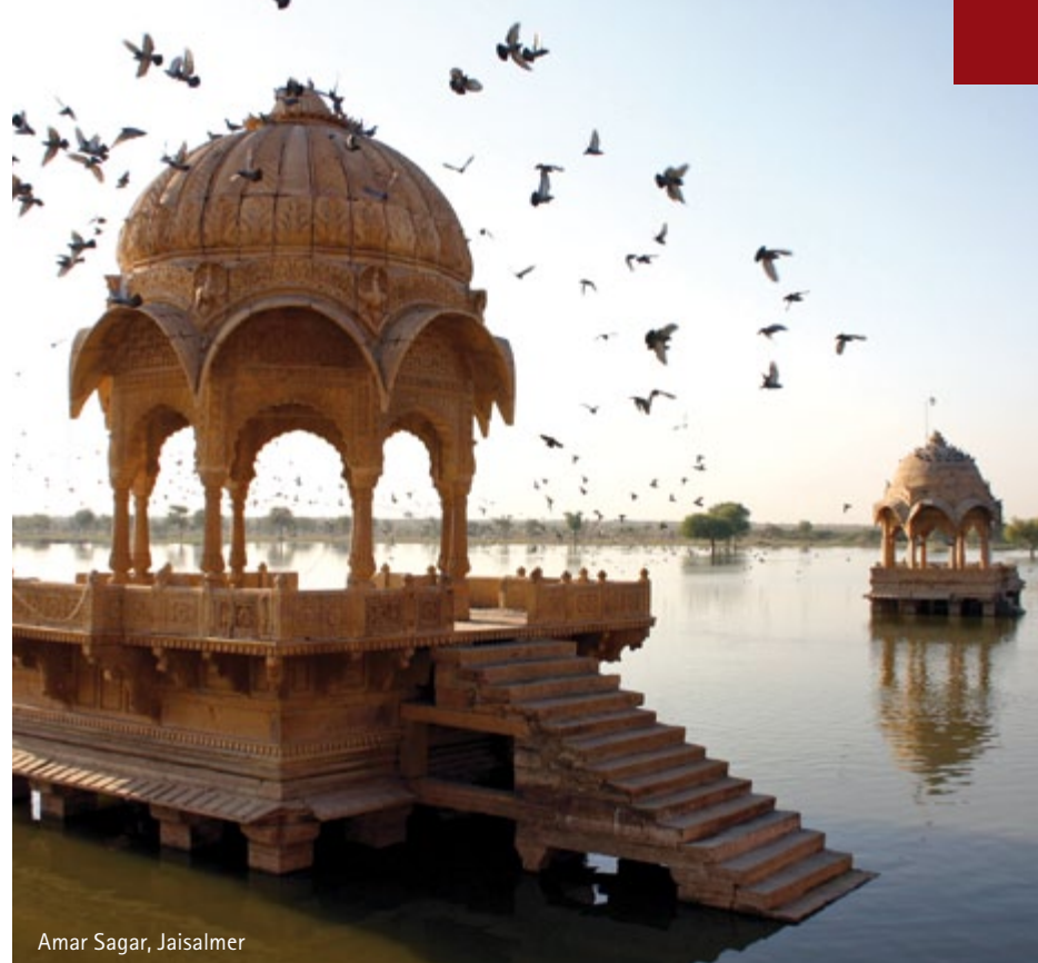
Amar Sagar, Jaisalmer

Proseguimento per Rohetgarh. Lungo il tragitto sosta a Jodhpur, cittadina al confine col Deserto del Thar e seconda città del Rajasthan dopo Jaipur. Jodhpur è detta anche la "città blu" per le case color indaco situate nella parte vecchia della città. Visita del Forte Meherangarh, del Jaswant Thada e del Palazzo Umaid Bhawan.