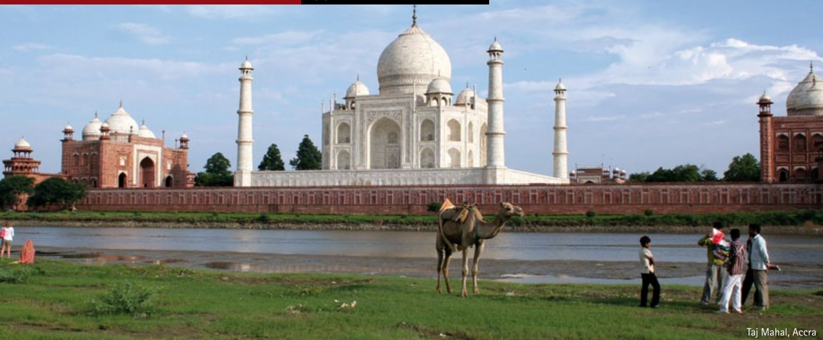
Taj Mahal, Accra