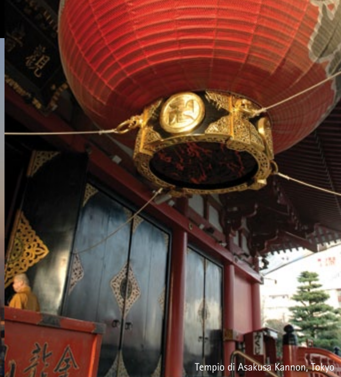
Tempio di Asakusa Kannon, Tokyo