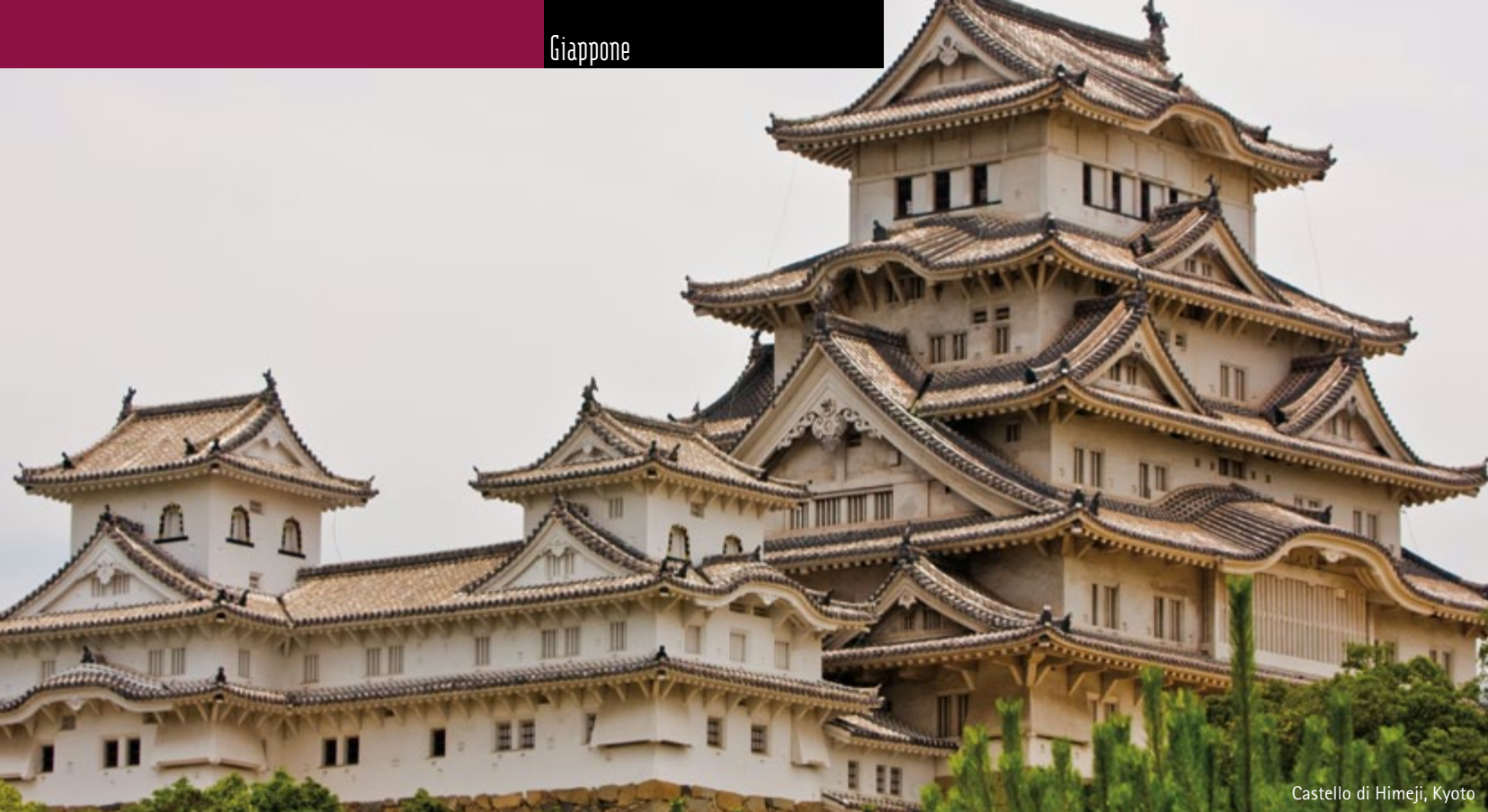
Castello di Himeji, Kyoto