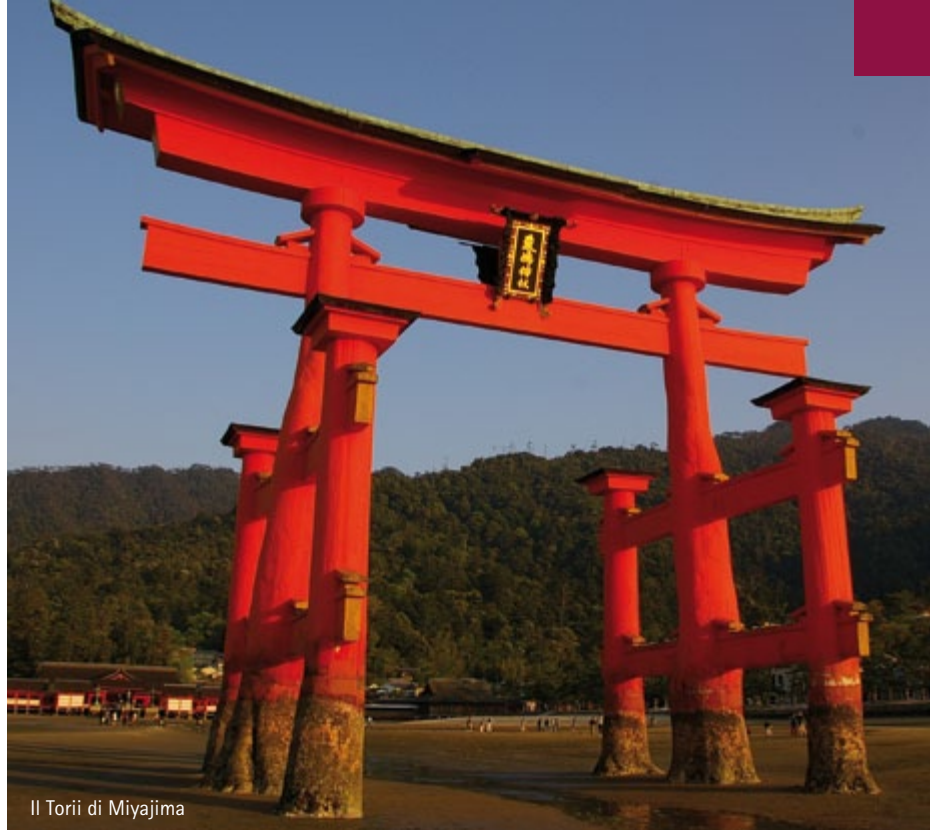
Il Torii di Miyajima

Prima colazione in hotel e partenza per la visita di un'intera giornata al patrimonio storico della città: il tempio Kinkakuji,