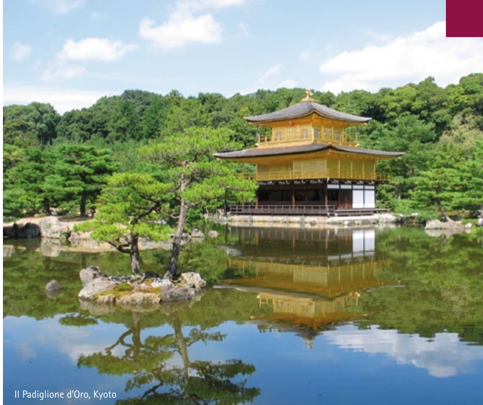
Il Padiglione d'Oro, Kyoto