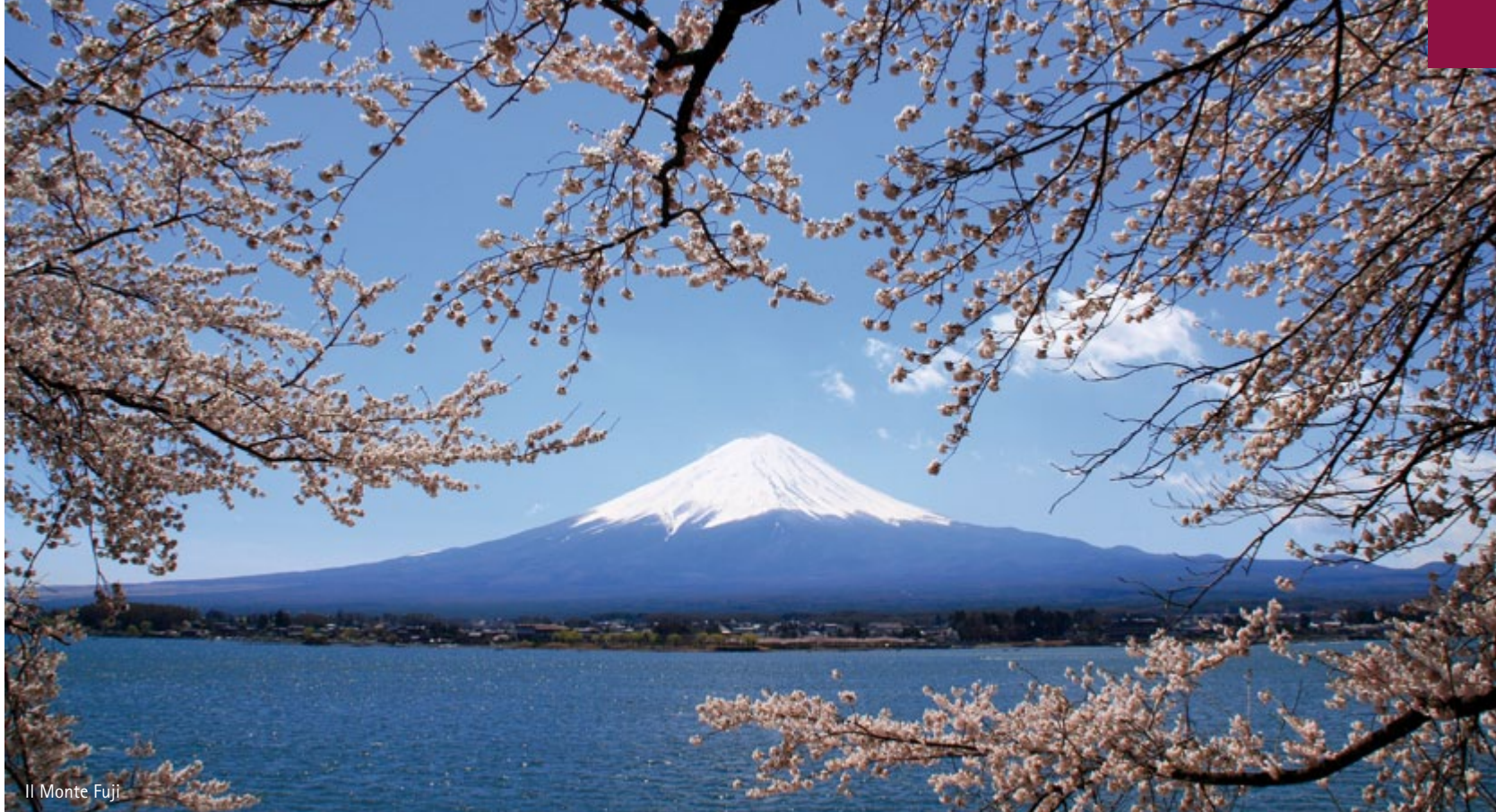
Il Monte Fuji