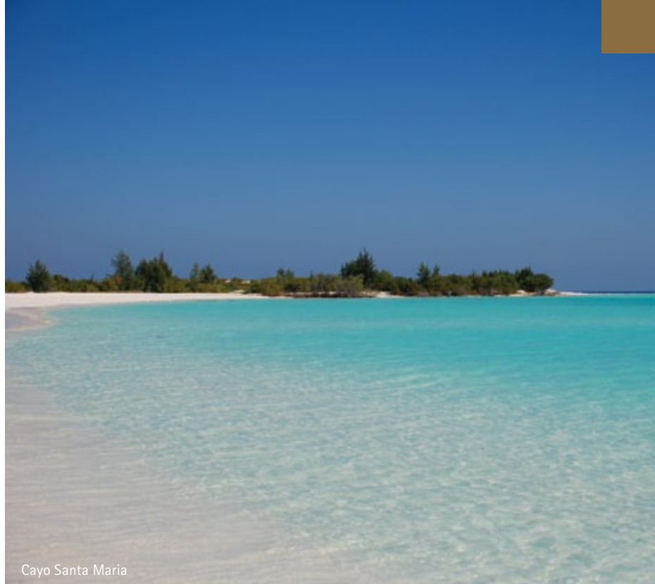
Cayo Santa Maria

Prima colazione in hotel e partenza per un'escursione al Massiccio dell'Escambray, uno dei rilievi montuosi più importanti di Cuba.