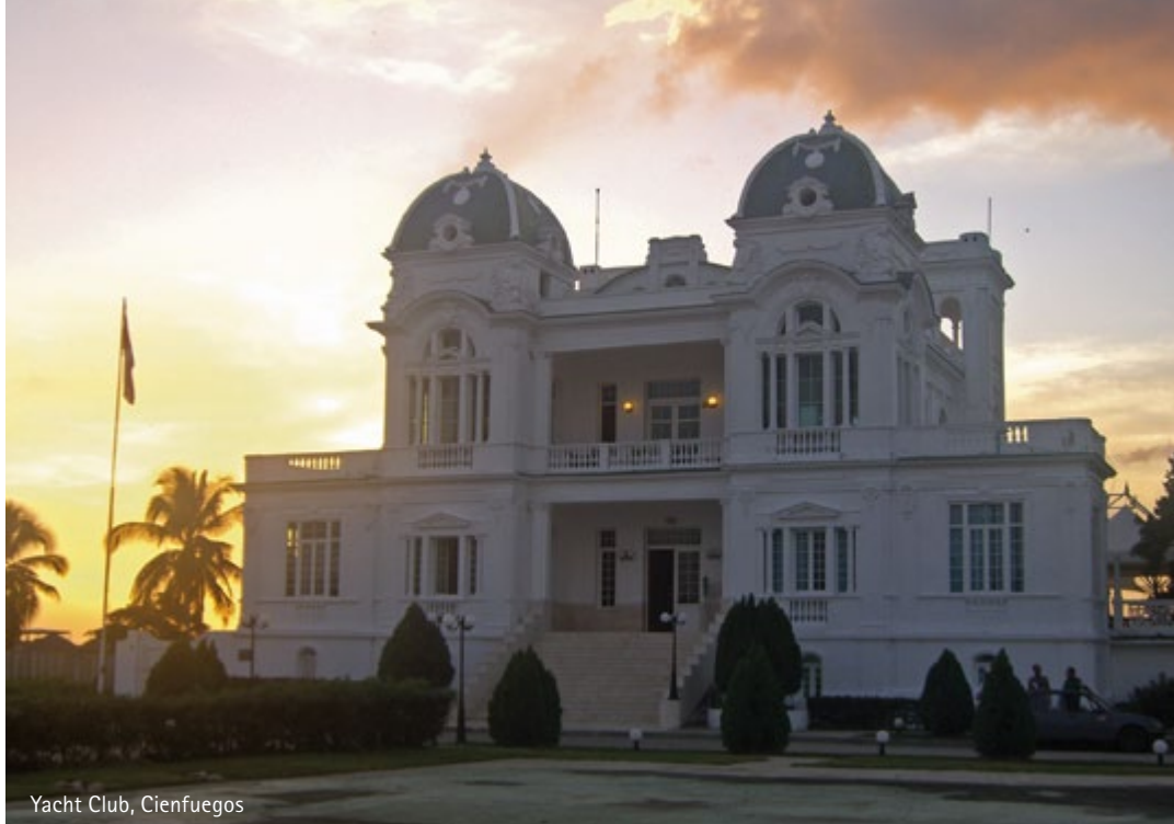
Yacht Club, Cienfuegos