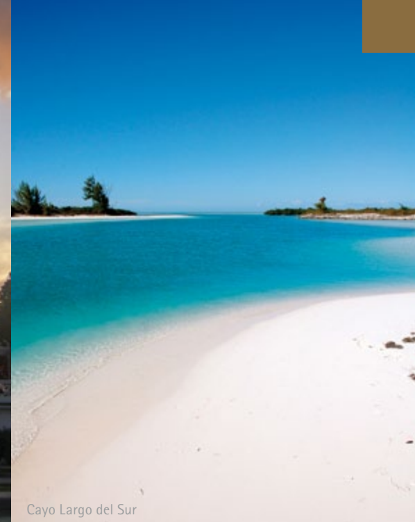
Cayo Largo del Sur