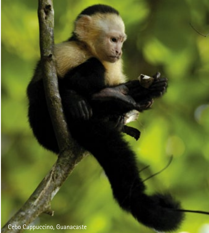
Cebo Cappuccino, Guanacaste