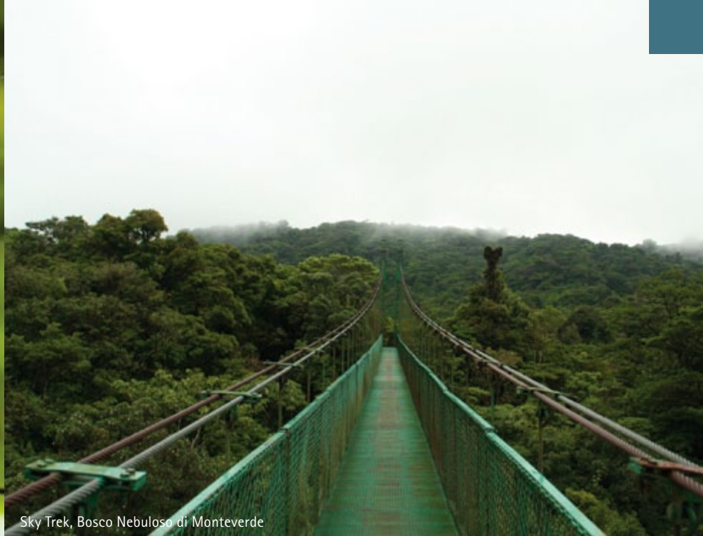
Sky Trek, Bosco Nebuloso di Monteverde