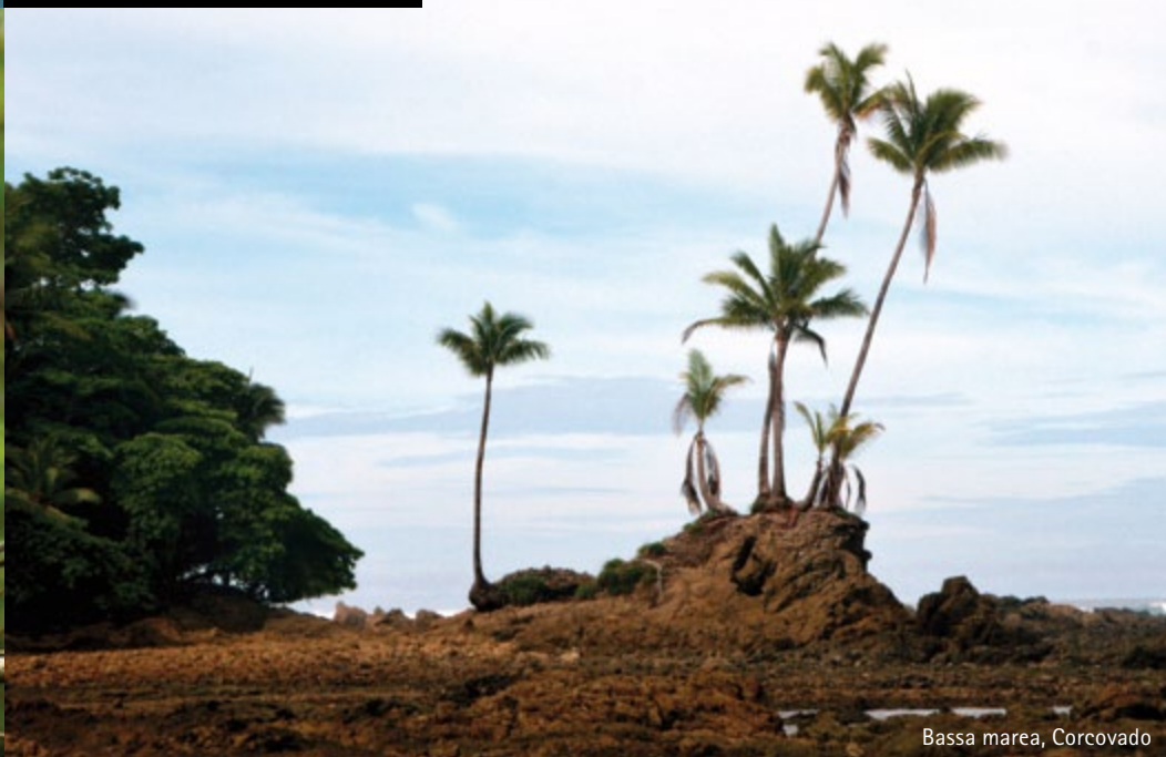
Bassa marea, Corcovado