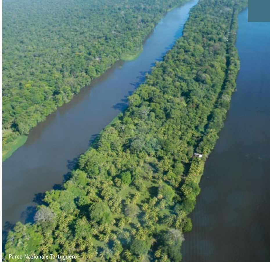
Parco Nazionale Tortuguero

Prima colazione. Tempo libero per un giro orientativo della città. Nel pomeriggio trasferimento in aeroporto e imbarco sul volo diretto a L'Avana dove un nostro rappresentante sarà ad attendervi per il trasferimento in hotel. Pasti a bordo. Pernottamento.